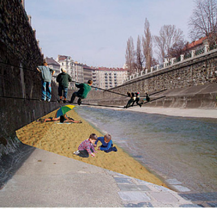
Mit freundlicher Unterstützung von: Landesjugendreferat Wien, Buchdruckerei Waniek, Druckerei Jentzsch, Textildruck Sommer.

Kontakt: www.kinderhaushofmuehlgasse.com an-wuebben@gmx.net