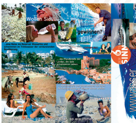
Mit freundlicher Unterstützung von Raiffeisenbank Wien-Niederösterreich