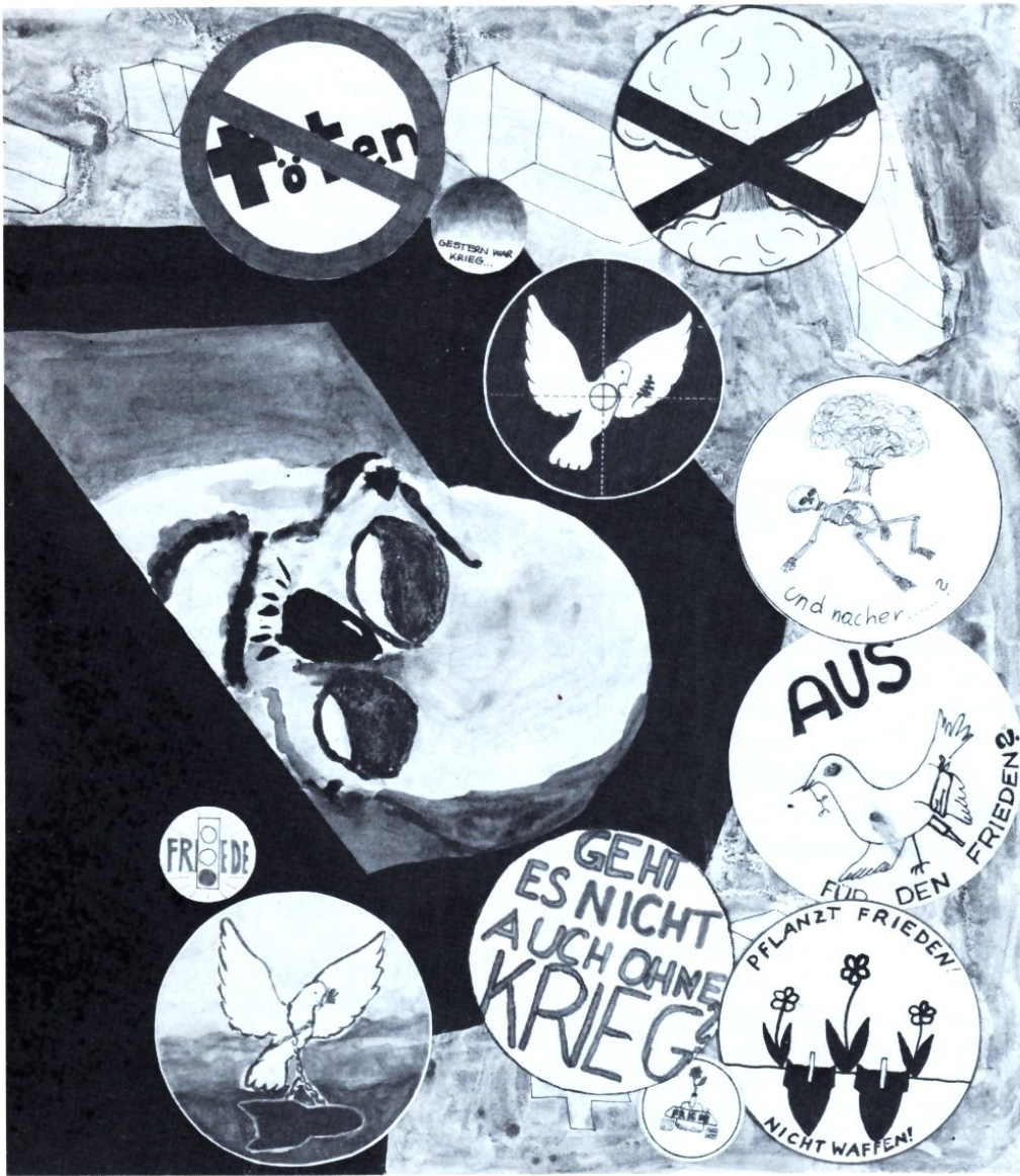
Kombination von Friedensabzeichen – Allgemeinbildende höhere Schule, 4. Klasse.

... die Schüler über zwei Wochen hinweg Tageszeitungen daraufhin absuchten, ob und was sie zum Rüstungs-/Friedensproblem zu schreiben hatten und wir daraus Schlüsse zogen;