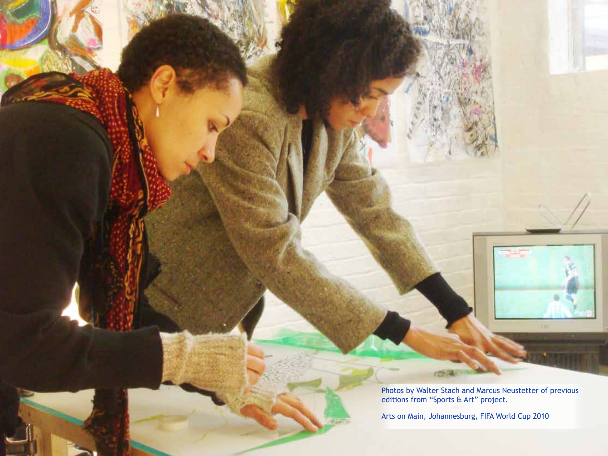
of previous editions from “Sports & Art” project.

Arts on Main, Johannesburg, FIFA World Cup 2010